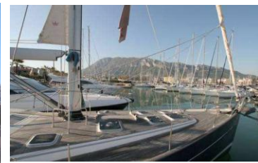
Marina de Dénia (sur de la ciudad)