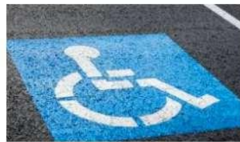
Plazas parking reservadas