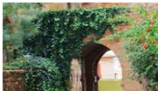
Monumentos, edificios oficiales y otras zonas accesibles