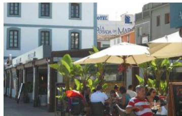
Explanada del Raset