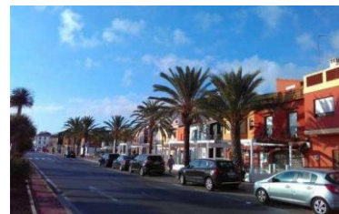
Explanada del Raset