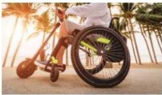
Alquiler de vehículos para personas con movilidad reducida